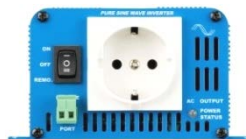
Phoenix Inverter 12/180 with Schuko socket