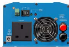
Phoenix Inverter 12/800 with BS 1363 socket