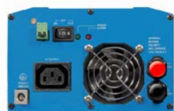
Phoenix Inverter 12/800 with IEC-320 socket