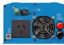
Phoenix Inverter 12/800 with AN/NZS 3112 socket