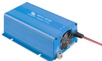
Phoenix Inverter 12/180