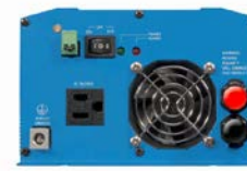
Phoenix Inverter 12/800 with Nema 5-15R socket