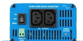
Phoenix Inverter 12/350 with IEC-320 sockets