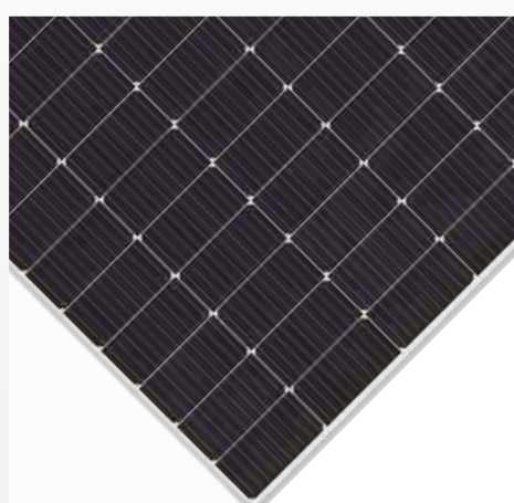
SHARP NB-JD BIFACCIALE TOPCON