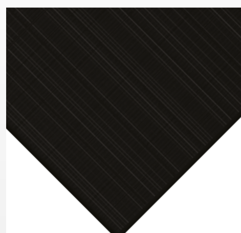
SHARP NU-JC FULL BLACK TOPCON