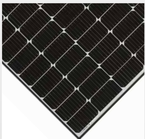
JINKO TIGER NEO