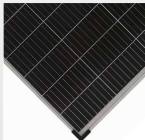
OFFGRIDSUN 36 CELLE