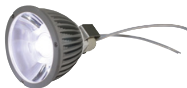
Zoccolo GU4/5.3 per Steca ULED 3 (ampio supporto a griffe) e Steca ULED 5 (piccolo supporto a griffe)