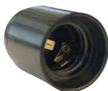
Zoccolo E27 per Steca Solsum ESL e Steca ULED 11

I diversi tipi di portalampade offerti da Steca consentono di installare comodamente tutti i tipi di illuminazione Steca.