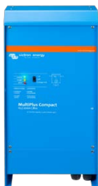
MultiPlus Compact 12/2000/80